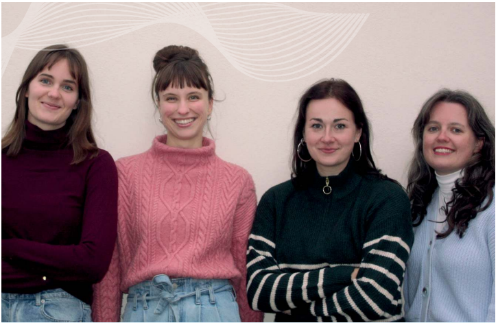
Team der Feminale | Bild: Negin Razzaghi