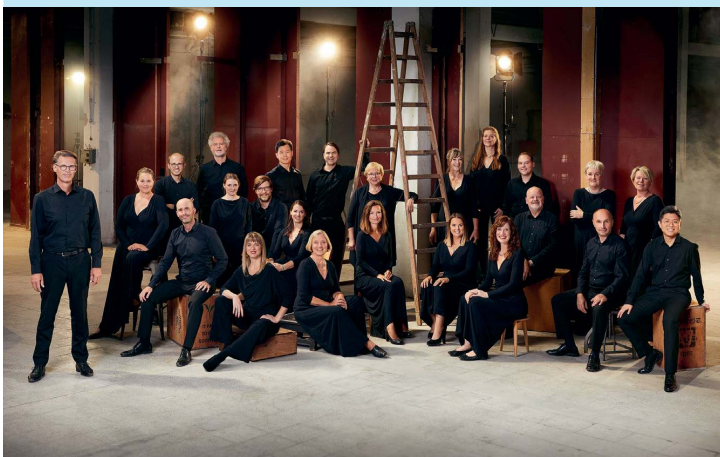
NDR Vokalensemble | Bild: Marius Engels