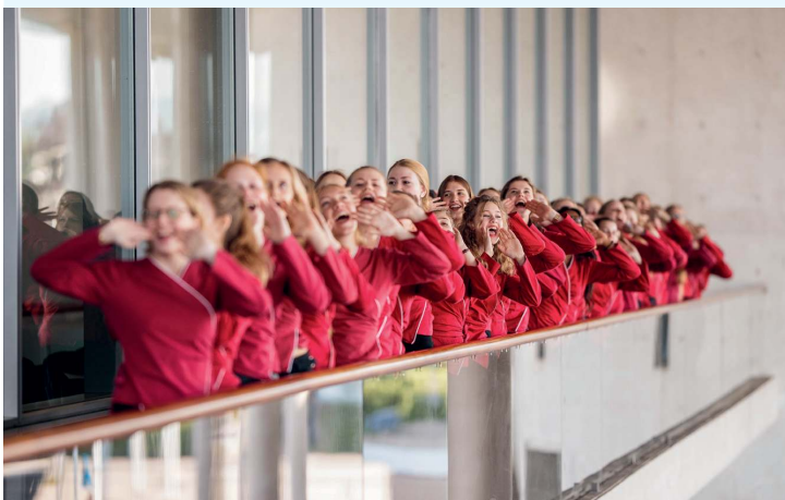
Mädchenchor Hamburg